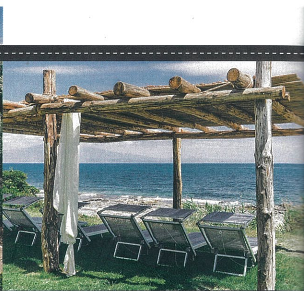
▲ MANGIA'S BRUCOLI RESORT ▲