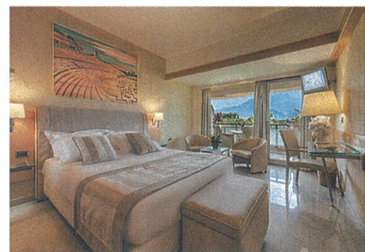
▲ ACACIA RESORT ▼